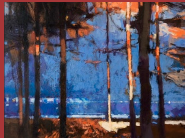
▲ Gerd Mackensen – bis 31.10. in der Galerie Peters-Barenbrock

Bitte beachten Sie die jeweiligen Hygienekonzepte und -auflagen der Veranstalter. Informieren Sie sich vor Veranstaltungsbeginn über die geltenden Richtlinien. Änderungen und Absagen vorbehalten aufgrund der aktuellen Corona-Landes-Verordnung.