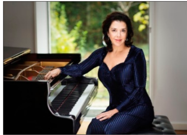
Elena Bashkirova gastiert am 10.10. um 20 Uhr im Rahmen der Kammermusiktage im Kunstmuseum.