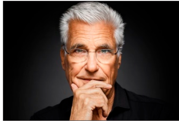
Sky du Mont liest im Rahmen der Ahrenshooper Literaturtage am 1.10. um 20 Uhr im Hotel The Grand aus seinen Büchern.