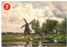
7 In den Boddenwiesen Carl Malchin Boddenblick mit Mühle, 1893