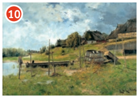
10 Auf dem Spielplatz am Hafen Elisabeth von Eicken Stille Stimmung an der Fulge (Althagen), um 1893