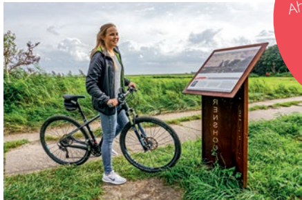
Der Kunstpfad lässt sich am besten mit dem Rad erkunden.

Unser Tipp: Die Kurverwaltung Ahrenshoop bietet von Mai bis September Radführungen entlang des Kunstpfades an.