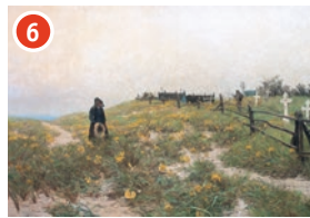
6 Vor dem Schifferfriedhof Paul Müller-Kaempff Der alte Schifferfriedhof in den Dünen, 1893