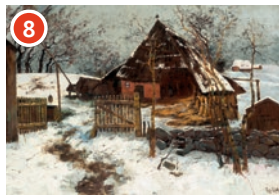
8 Im Garten des Dornenhauses Elisabeth von Eicken Dornenhaus im Tauschnee, um 1893/94