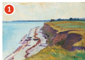
1 Direkt am Steilufer Hugo Jaeckel Hohes Ufer, um 1910–1915